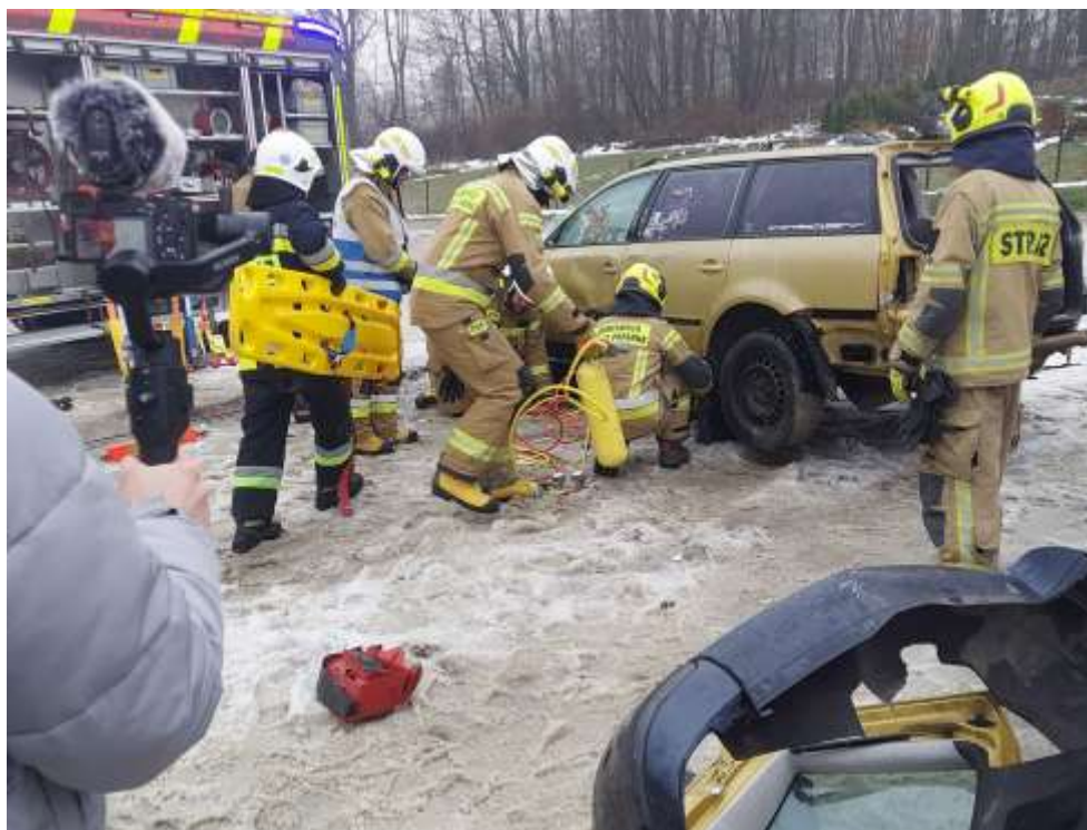
Показ порятунку на ДТП. Навчальний візит «Вогнеборці. Зміцнення спроможності українських громад шляхом розвитку добровільних пожежних команд»

Згідно статті 63 КЦЗУ та Порядку утворення та функціонування пожежно-рятувальних підрозділів для забезпечення добровільної пожежної охорони ДПО займається гасінням пожеж, проведенням аварійно-рятувальних та інших невідкладних робіт.